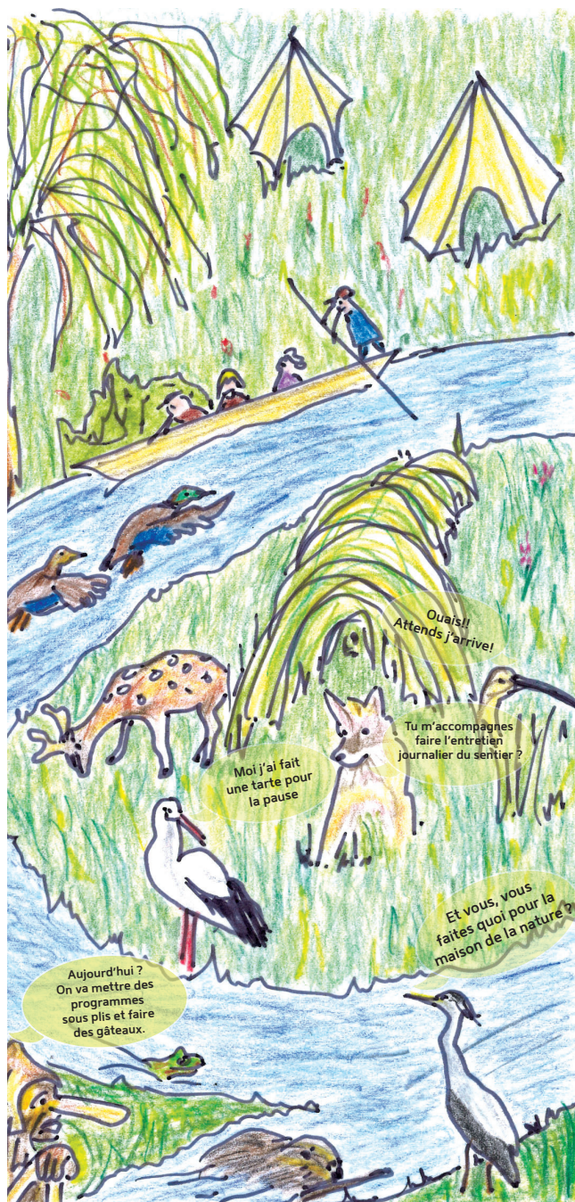
Illustration arrière : Renée Weber.

Conception graphique : Mélanie Stoebener/melanie.stoebener@gmail.com/Crédits photos : Ried Man et Denis Genber/Ne pas jeter sur la voie publique